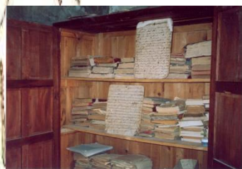
La Khizana (Bibliothèque) de la Zawiyya Ouboudaoud