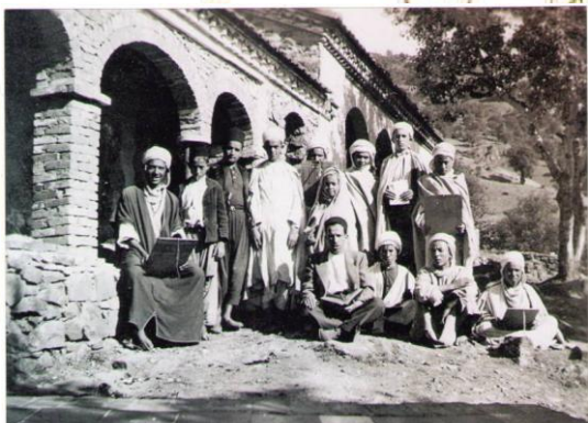
Les élèves de la Zawiyya - Institut de Taslent - Akbou (vers 1940)

ملتقى - Colloque scientifique – Timlilit