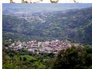
Taslent et Djebel Nur au Douar Ighram