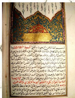
Manuscrit de transactions